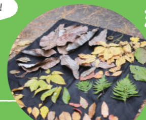
大人も遊んじゃおう！