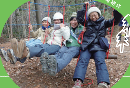
森のようちえん指導者研修