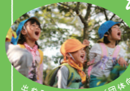
出前型森のようちえん (団体向け)